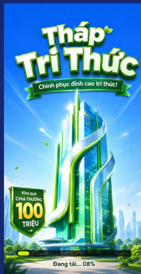
Hiển thị trang loading