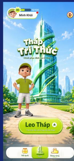
Tới trang (sảnh) chính của Tháp Tri Thức.