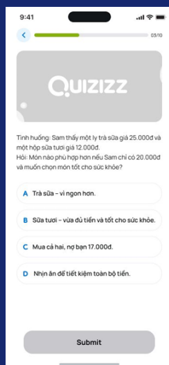
Trả lời các câu hỏi trong Tháp Trí Thức