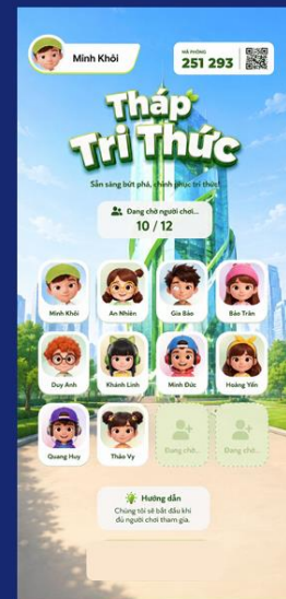
Tham gia phòng chờ, chờ đủ người/thời gian để start