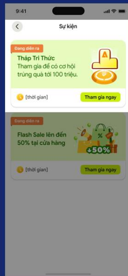
Truy cập Tháp Tri Thức từ trang sự kiện trên Maxtopia